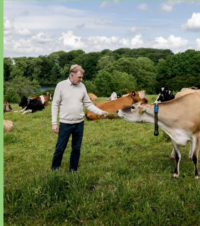
Syddjylland: Økologisk landbrug og skovlandbrug på Gram Slot