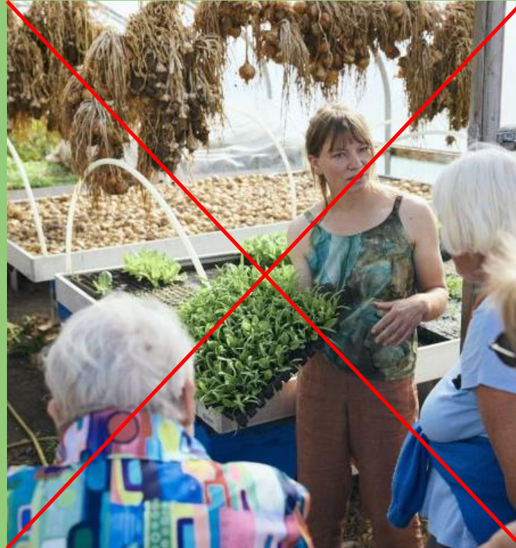
AFLYST: Regenerativt gartneri hos Høsteriet