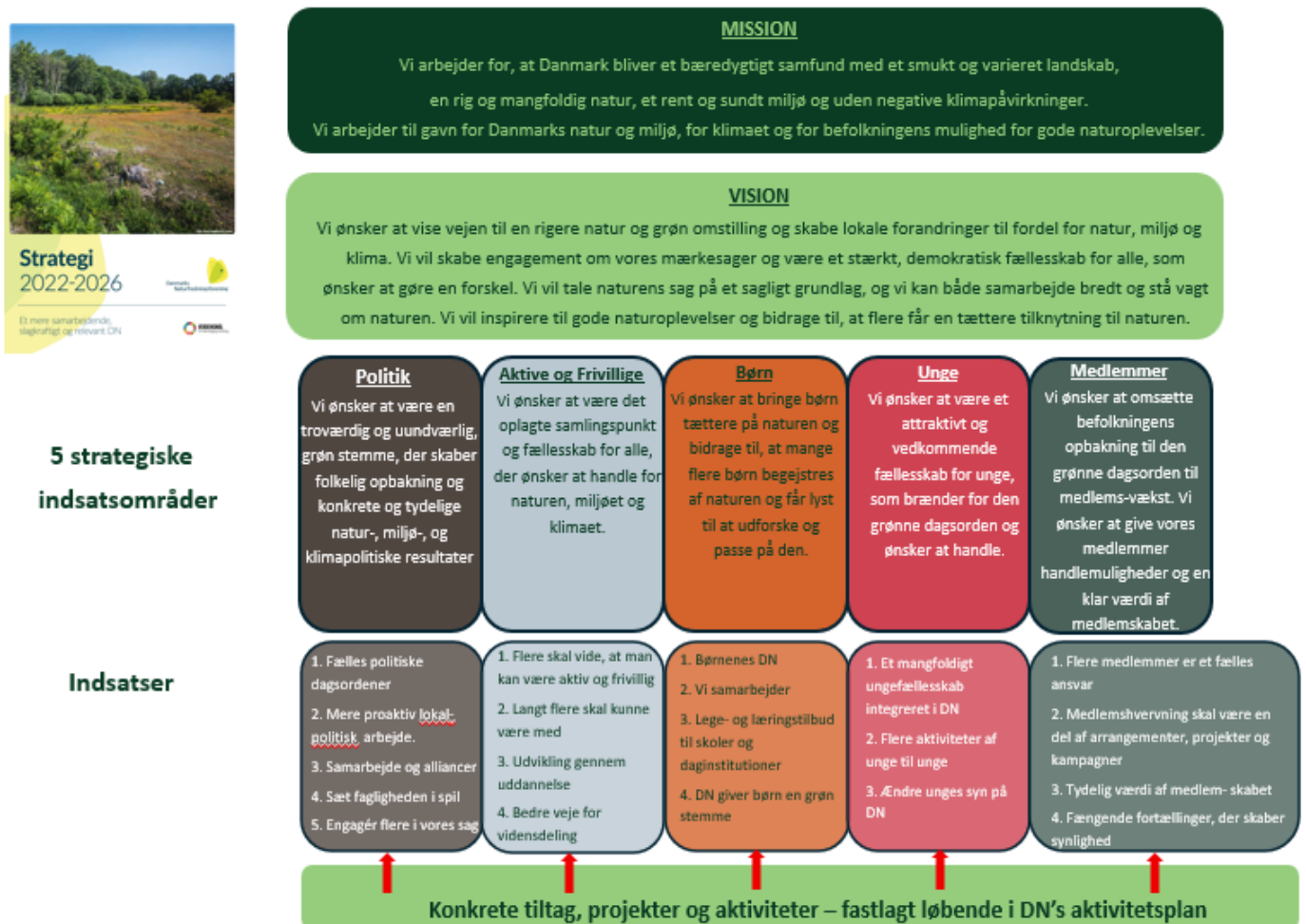
Figur 1: Overblik over strategiens vigtigste dele, som viser hvordan de konkrete aktiviteter, tiltag og projekter hænger sammen med og understøtter strategien

Siden strategiarbejdet for alvor gik i gang i 2020, og dens vedtagelse i 2021, har DN oplevet en positiv udvikling og fremgang på flere vigtige parametre: