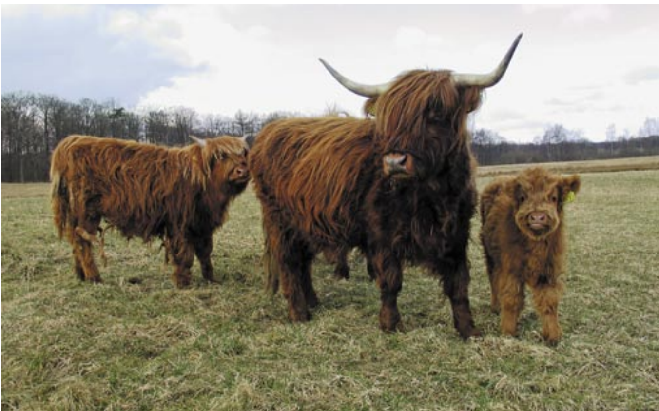
Skotsk Højland er fremragende naturplejere og flotte at se på.

Køer, hvor kalvene bliver ved moderen, kaldes for ammekøer. De er gode naturplejere og er normalt rolige dyr. Man skal dog være opmærksom på,