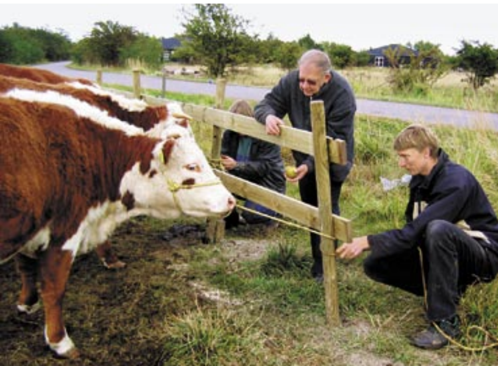
Hvis man har håndtamme dyr kan man bruge et fanghegn i stedet for en egentlig fangefold, når man skal indfange sine dyr.

En god fold er indrettet, så der er kørefast vej helt til leddet. I folden må der gerne være skygge til dyrene, og den må gerne være indrettet, så de har mulighed for at kunne gå lidt i fred. Råder man over et større areal,