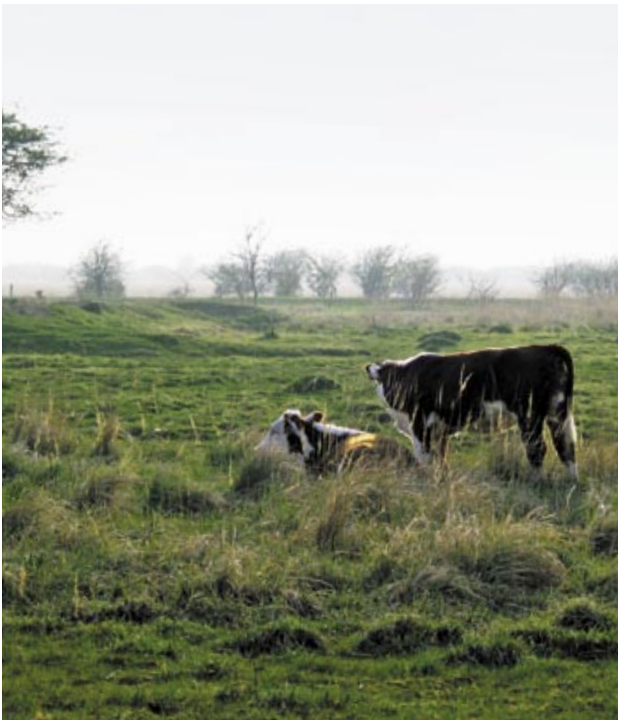
Hereford er en af de racer, der kan anvendes til helårsgræsning.