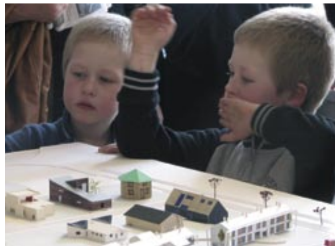
I Herfølge ved Køge bygges 76 svanemærkede huse. Udstillingen har turneret i 2006, og i 2007 bliver de fleste huse færdige – se mere på www.fremtidensparcelhuse.dk .

Danmarks Naturfredningsforening har også en folder om miljørigtigt byggeri, som du kan bestille via DN-nettet.