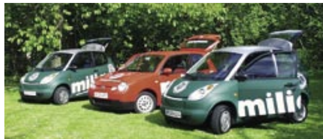
Elbiler er nu et realistisk alternativ – I Albertslund Kommune har man i en årrække brugt elbiler til forskellige formål.

Miljøstyrelsen har udarbejdet nogle nøgletal, som vi kan trække frem, og som siger lidt om, hvor meget det batter, hvis man vælger miljørigtigt ved indkøb og brug af produkter, se næste side.