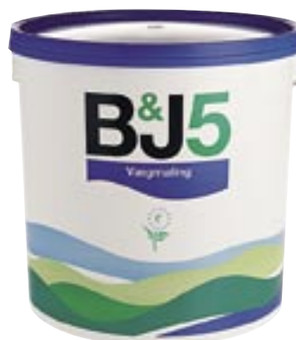
Maling bruges i store mængder til vedligeholdelse af offentlige bygninger; det kan fås blomstmærket. Beck & Jørgensen www.bj.dk .