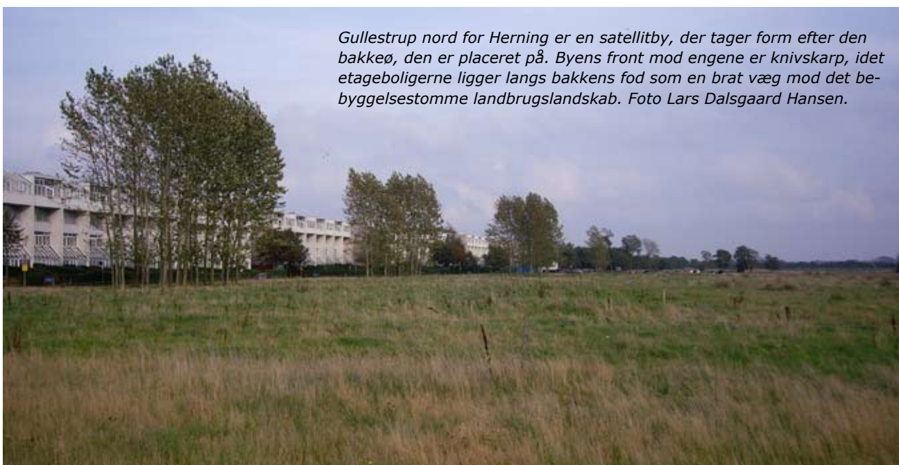
Gullestrup nord for Herning er en satellitby, der tager form efter den bakkeø, den er placeret på. Byens front mod engene er knivskarp, idet etageboligerne ligger langs bakkens fod som en brat væg mod det bebyggelsestomme landbrugslandskab.

Der er således mulighed for at tilgodese bilforhandlerens reklamebehov, samtidig med at det samlede erhvervsområde er indpasset og venligt i forhold til omgivelserne.