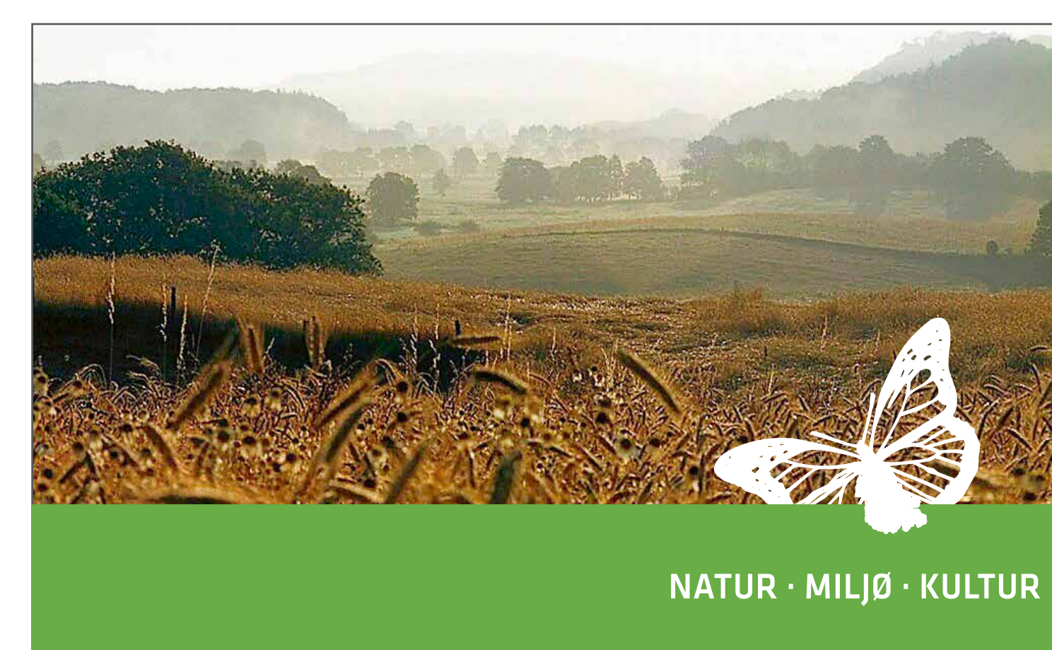
Det smukke landskab ved Vork bakker, rute 2, 6 og 8