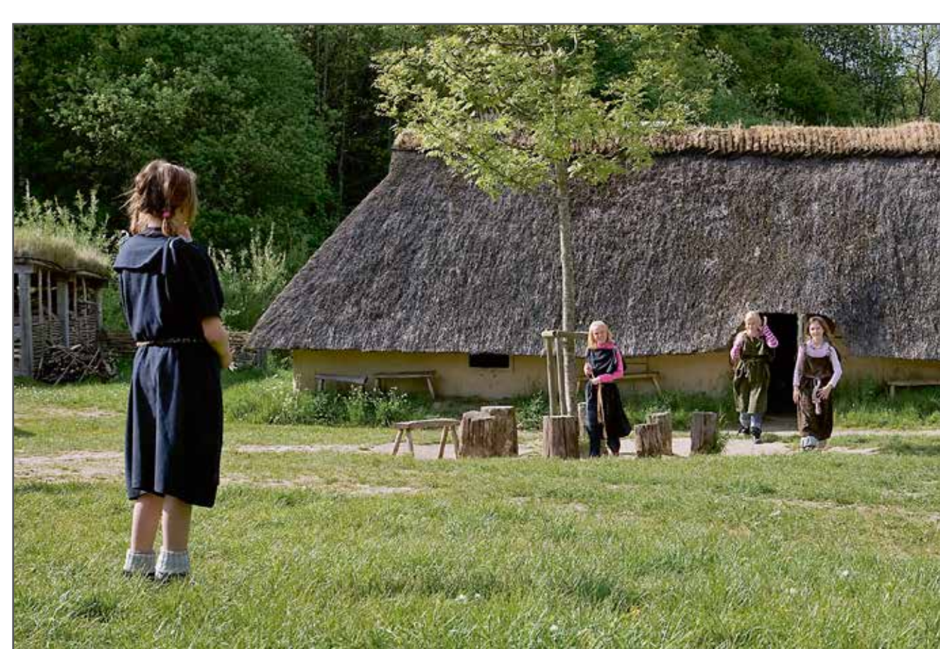
Jernaldermiljøet. Her kan du gå en tur rundt og se på husene og livet i jernalderen