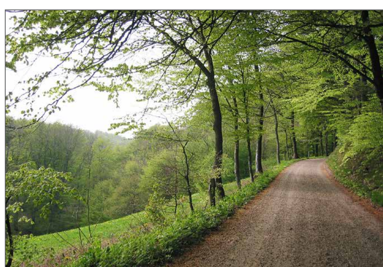
Rute 2 og 8 på vej ud ad Vingsted Skovvej