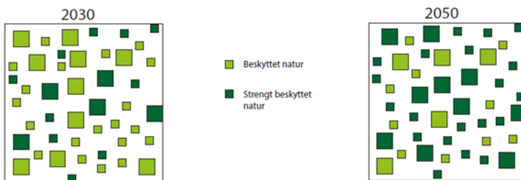
Figur 2 Mere strengt beskyttet natur med større sammenhæng i perioden 2030 - 2050

Figur 2 ovenfor illustrerer et andet element i sekretariatets indstilling, nemlig at 10% ud af de 20 % af de "Beskyttede områder" overgår til "Strengt beskyttet" natur i perioden 2030 – 2050 og skal som led heri medvirke til at forøge sammenhængen og størrelsen af den "strengt beskyttede" natur.